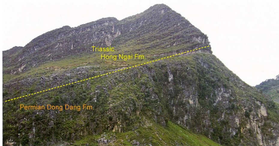
図2. ハーザン省ドンバン地域のルンカム (Lung Cam) セクションにおけるペルム系ドンダン層と下部三畳系ホンアイ層。ホンアイ層最下部からは、三畳紀の始まりを告げるコノドントの Hindeodus parvus が産出する。