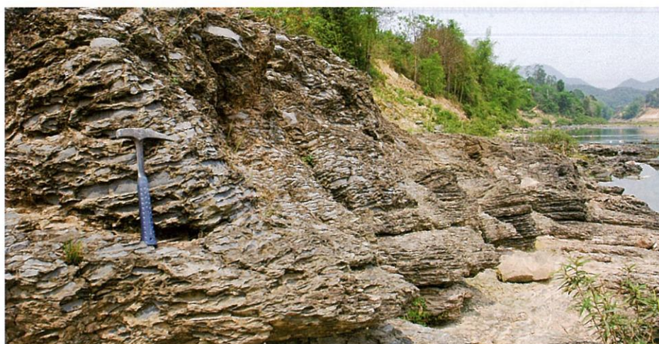
図3. 下部三畳系バックテウイ層の石灰角礫岩 (ランソン地域キーコン川沿い)。石灰角礫岩は、礫支持あるいは基質支持の典型的な土石流堆積物で、孤立型炭酸塩プラットフォームの斜面相を形成していた (Komatsu et al. , 2014)。