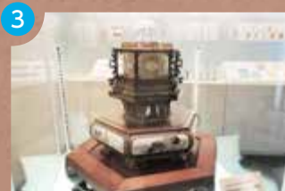
2F 科学技術への誘いコーナー

こちらも家畜のヒツジに近縁の種類です。山岳に住んでいた祖先の種類から体が大型になって、大きな角を持つように進化しました。