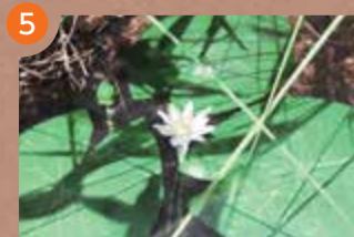
1F 地球の多様な生き物たち コーナー

分類 シダ目ウラジロ科 学名 Gleichenia japonica シダは漢字で「羊歯」と書きます。シダの仲間ウラジロは、名前のとおり葉の裏が白いです。お正月のしめ飾りなどに使用されます。