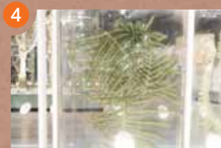
1F 地球の多様な生き物たち 系統広場コーナー

時代 1851(嘉永4)年 製作 田中久重 出品 株式会社東芝七宝、螺鈿(らでん)細工などで美しく装飾されたゼンマイで動く置き時計です。時計の「十千十二支文字盤」の面に、「未(ひつじ)の刻」が見られます。