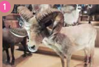
3F 動物たちが生きるための知恵コーナー