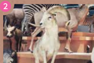
3F 動物たちが生きるための知恵コーナー

家畜のヒツジに近縁の種類です。ユーラシア大陸に生息していた祖先の種類から進化して、複雑で重厚な角を備えています。