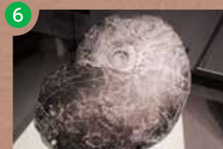
B2F 地球環境の変動と生物の進化コーナー

分類 スイレン科 学名 Nymphaea tetragona スイレンの仲間水草です。名前の「ヒツジグサ」は、花を咲かせる時間が昔の「未(ひつじ)の刻」、現在の午後2時ごろであることに由来するそうです。