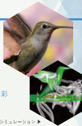
飛行シミュレーション ▶

地球にはさまざまな生き物が住んでいますが、羽ばたき飛行を行うのは昆虫・翼竜・鳥類・コウモリだけです。ここでは鳥類に焦点を絞り、飛行のバイオミメティクスを見ていきます。また、彼らの羽毛の美しい色彩をまねる試みもあわせて紹介します。