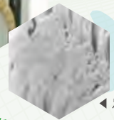
◀ 足裏の電子顕微鏡写真