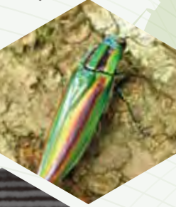
◀ 翅断面の電子顕微鏡写真

昆虫は、全生物の半分以上の種数をもつといわれる大きな一群です。昆虫のからだには、まだまだあまり知られていない、特殊な働きや構造が多数備わっています。現在、これらを人間の工学技術にどのように取り入れるのか、注目が集まっています。