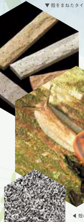
▼殻をまねたタイル

バイオミメティクスとは、生物学と工学が連携・協働し、生物に学びながら私たちの暮らしをより良くすることを目指す新しい学問です。例えば、ハスの葉が水をはじくくみは汚れが付きにくい外壁材の開発に利用されています。従来はモノづくりへの活用が中心でしたが、最近では、シロアリの巣の空気循環構造を建物の省エネルギー空調システムに活かすなど、社会問題の解決や新しい人間社会のあり方につなげるべく、より広い視野で研究が進められています。本展では、昆虫・魚類・鳥類を中心に、バイオミメティクスの実例とそのモデルとなった生物、博物館が果たす役割、異分野の学術交流に役立つ情報科学技術などを紹介します。