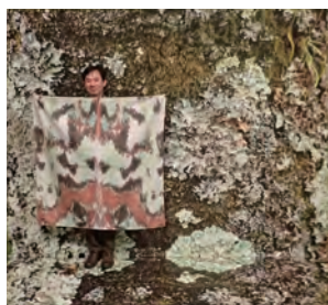
ガの模様で地衣類に擬態！ (展示物提供：飯田市美術博物館)