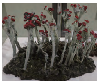
リアルなイオウゴケの3D模型