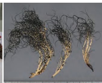
南極産地衣類標本 ナンキョクサルオガセ