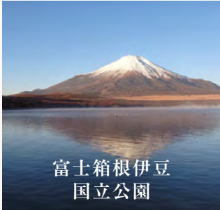
富士箱根伊豆 国立公園