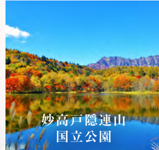
妙高戸隠連山 国立公園