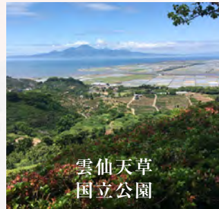
雲仙天草 国立公園