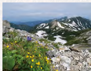
中部山岳国立公園

国立公園では、自然に囲まれてゆったりと過ごしたり、アクティビティを満喫したりと、さまざまな楽しみ方が可能です。また、その自然に育まれた地域特有の伝統文化に触れることもできます。本展を見終わってお気に入りの国立公園が見つかったら、実際に出かけてみませんか?会場では各国立公園の魅力を紹介するパンフレットも配布します。