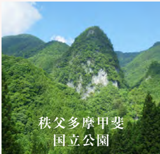
秩父多摩甲斐 国立公園