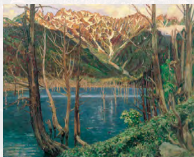
中澤弘光「上高地大正池」