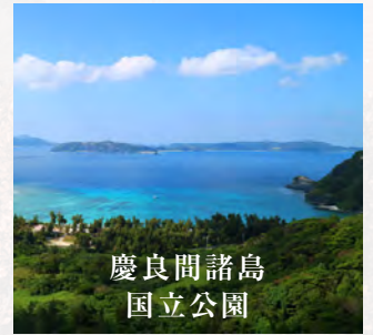
慶良間諸島 国立公園

国立公園には日本の自然を象徴する景観や生物多様性が残されています。会場では「大地」「水」「命」の3つのテーマで、動物や植物、岩石・鉱物といった 国立科学博物館が所蔵する200点以上の自然史標本 、そして 全34公園の高精細空撮映像 によりその姿に迫ります。あわせて自然に寄り添い生きてきた「人」の暮らしについても紹介します。