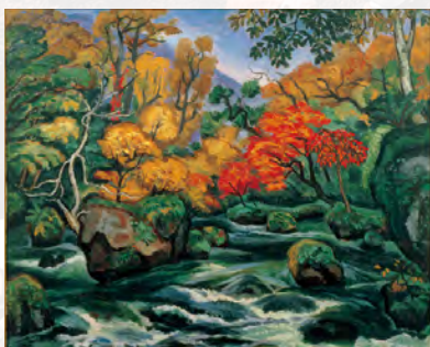
大野隆徳「奥入瀬溪流の秋」