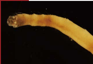
クマノアシツキ科のゴカイ