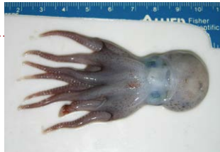
オグラグンバイダコ