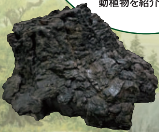
メタセコイア樹幹化石 所蔵：筑波大学

現生種発見のあと、研究者たちの努力でメタセコイアは再び世界に広がりました。自生地や日本での保全活動を紹介します。