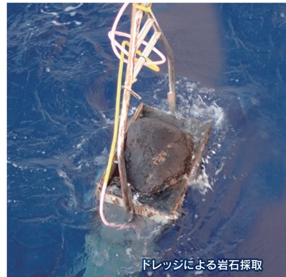
ドレッジによる岩石採取