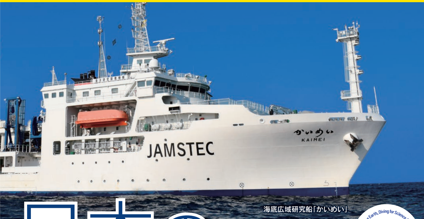
海底広域研究船「かいめい」