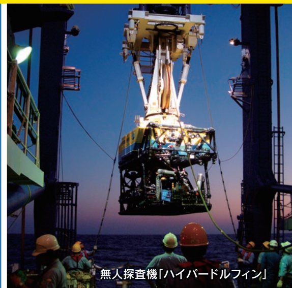
無人探査機「ハイパードルフィン」