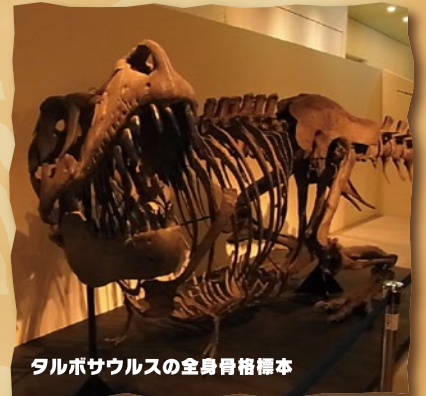
タルボサウルスの全身骨格標本