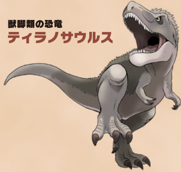
獣脚類の恐竜 ティラノサウルス