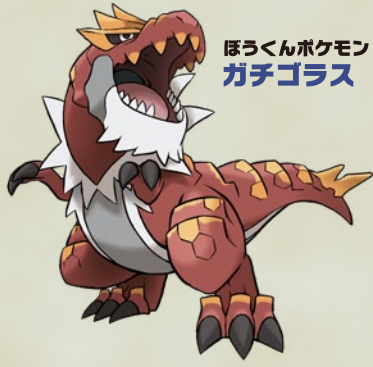
ほろくんポケモン ガチゴラス