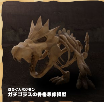
ほろくんポケモン ガチゴラスの骨格想像模型

「カセキポケモン」の実物大骨格想像模型が登場! 古生物の標本と、ポケモンの実物大骨格想像模型を比べてみよう!