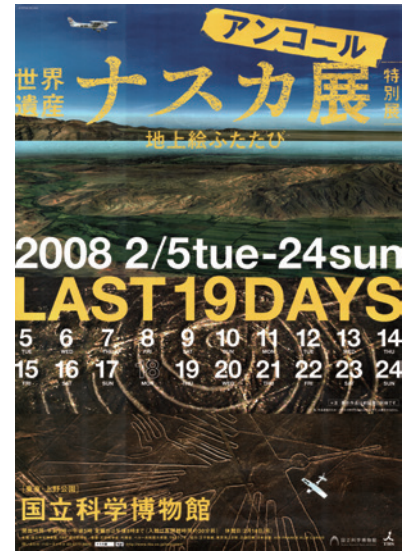
2008 | NAZCA