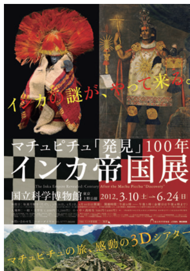
2012 | INCA