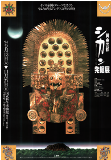
1994 | SICÁN

国立科学博物館では、1994年から2017年まで、TBSと共同で古代アンデス文明に関する特別展を合計6回開催しました。今年、ペルーと日本が外交関係を結んで150年の節目の年にあたります。このことを記念し、本展ではこれまで国立科学博物館で開催した古代アンデス文明に関する特別展を回顧します。