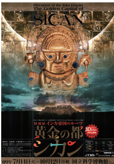
2009 | SICÁN