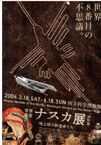
2006 | NAZCA