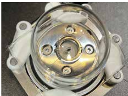
リュウグウサンプル ★