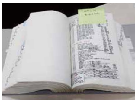
「はやぶさ2」運用日誌