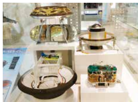
「はやぶさ」再突入カプセル(常設展示)