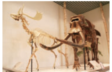
▲ 常設展示「徳島のナウマンゾウ」