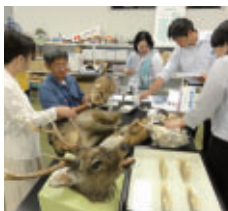
▲ 脊椎動物標本など