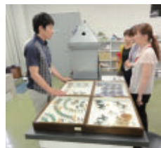
▲ タマムシ・チョウ標本