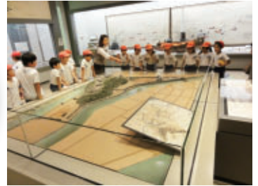
▲ 遠足 展示解説の様子