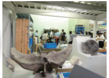
▲ 地学収蔵庫 見学の様子