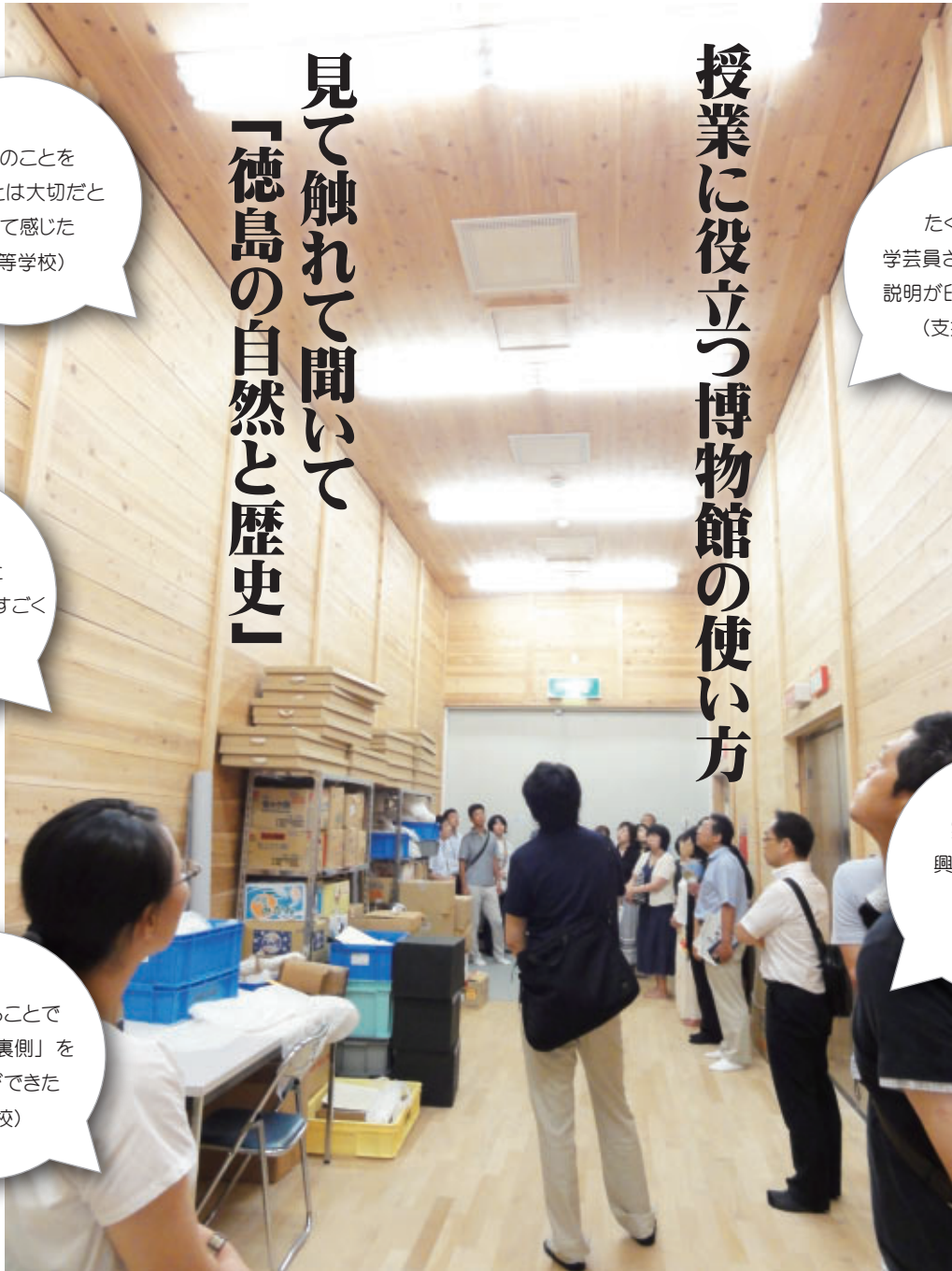
▲ 歴史民俗収蔵庫 見学の様子