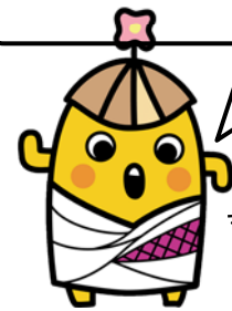
歴博 マスコットキャラクター はに坊