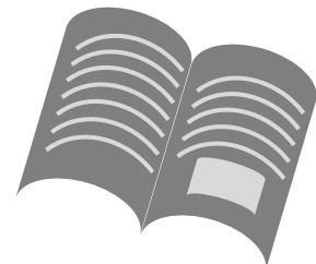
しよくぶつ 植物のかんさつきろく