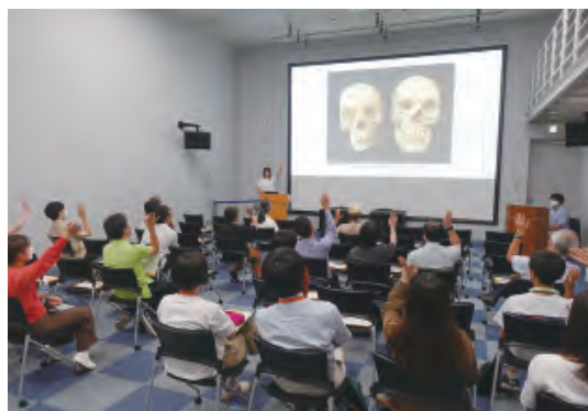
(SC1 : 受講者によるディスカバリートーク)