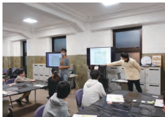
(SC2 : 受講者によるサイエンスイベント)