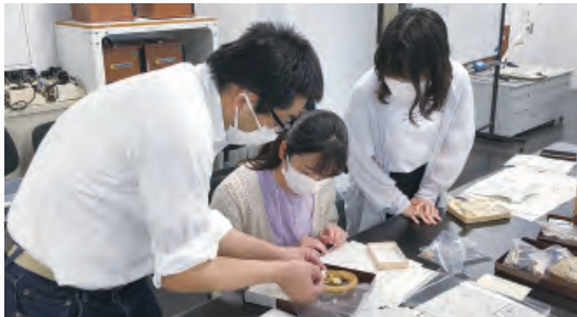
Aコース例：研究部での実習