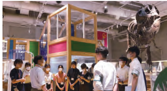
Bコース例：学習支援活動の見学