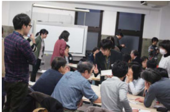
(SC2:対話型サイエンスイベントの様子)