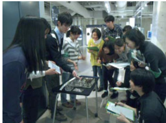
Bコース：学習支援プログラムの実施