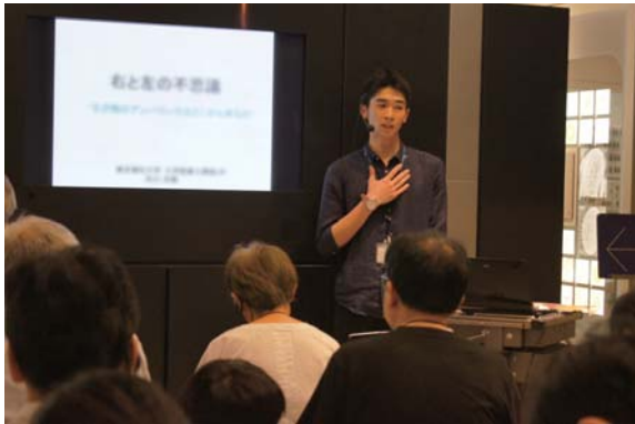
(SC1:ディスカバリートークの様子)