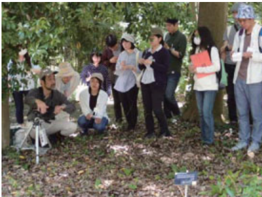
Aコース：植物園内での野鳥観察