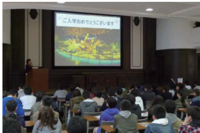
(新入生オリエンテーション)