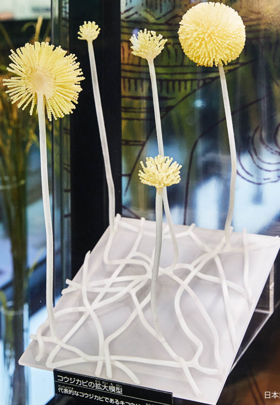
コウジカビの拡大模型 代表的なコウジカビであるキコウジの拡大模型。