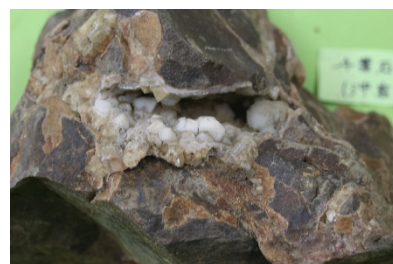
小谷村教育委員会の調査で採取された大型の千葉石の仮晶