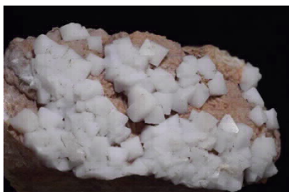
最初に採取され、フォッサマグナミュージアムに寄贈された千葉石の仮晶

採取された千葉石は来年度、小谷村郷土館とフォッサマグナミュージアムに展示公開する予定です。また、村では今後も研究者との共同調査、研究を継続していきたいと考えています。