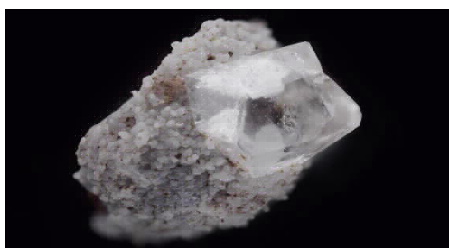
未変質の千葉石