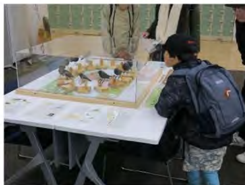
展示を観覧する来場者