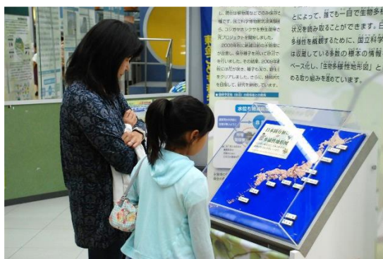
生物多様性立体地形図