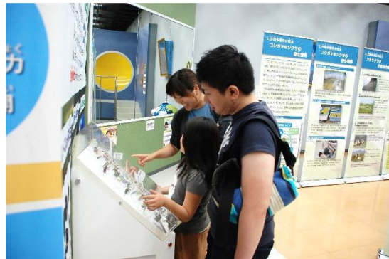
フィギュアで盛り上がる家族