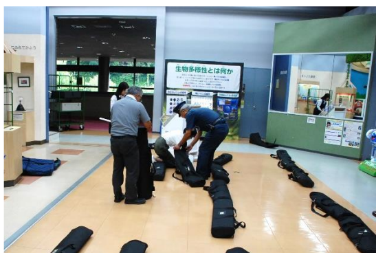
9/16 科博職員の立会いで撤収