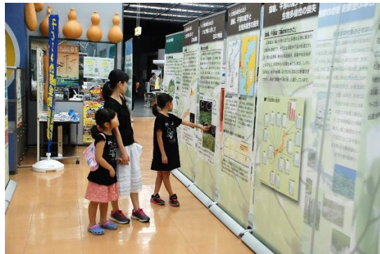
親子で語らいながら熱心に見入る姉妹