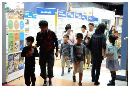
科学館活動や大・小ホールほかでイベントがある日は来館者多数。