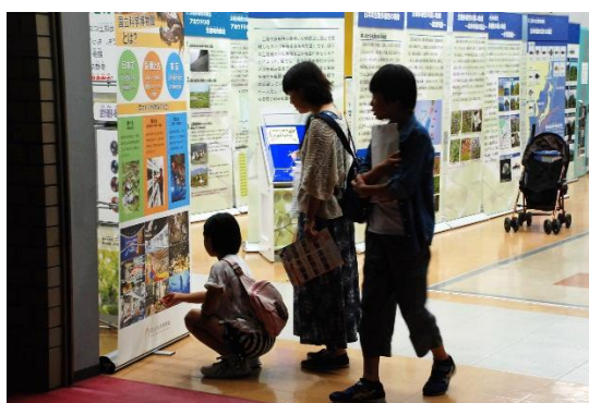
入口に国立科学博物館パネル