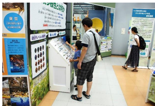
生物多様性フィギュアを指差す子