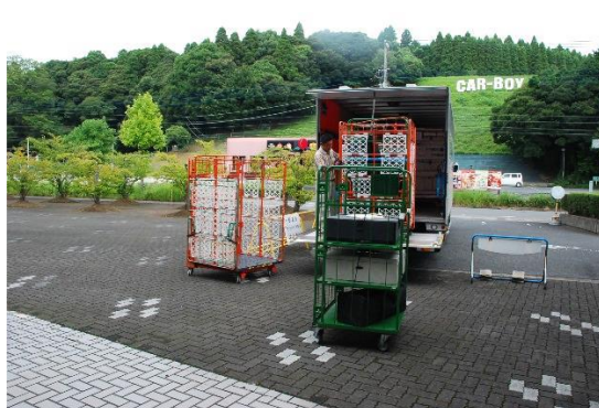
8/6 ボックスチャーター便到着