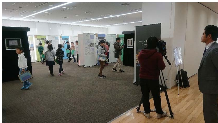
テレビ局取材の様子①