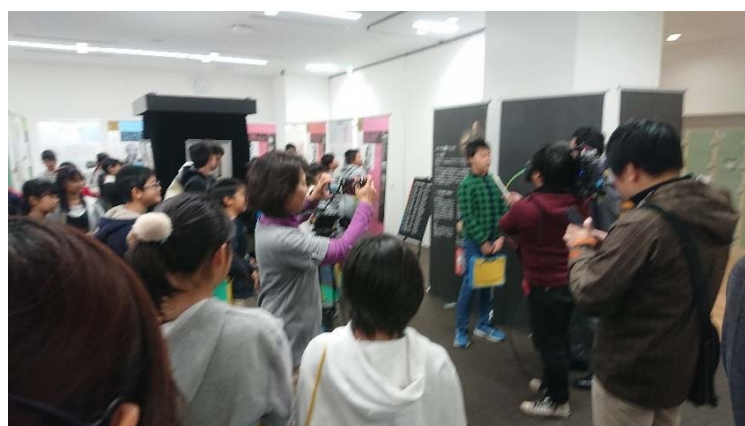
テレビ局取材の様子②