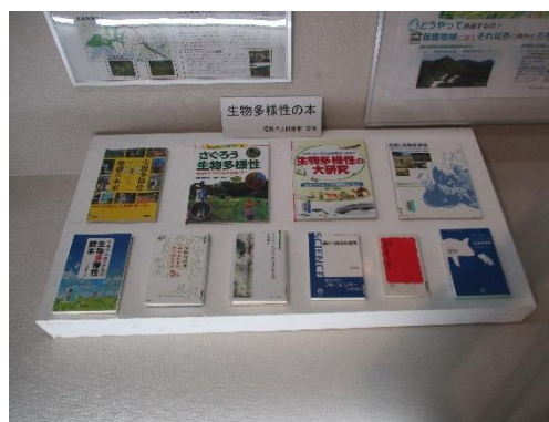
福島県立図書館からの借用図書