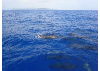
8. イルカ（オキゴンドウ）の群れ