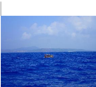
10. 背後の与那国島の北側の海岸（写真中央より右側）