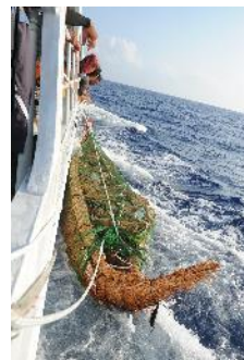
11. 曳航されるヒメガマ舟が見えて流されていることを認識した。