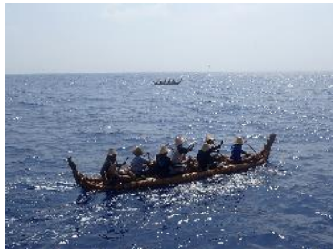
7. 沖に出て波が落ち着く