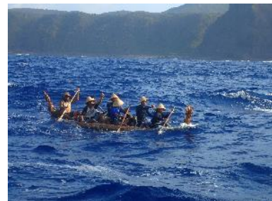
5. 島を出た直後は波が荒かった