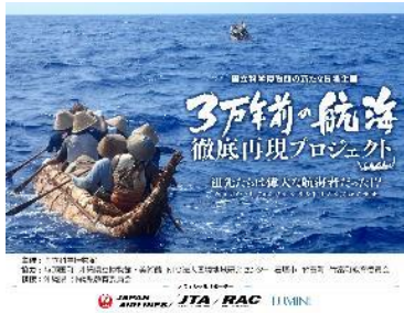
3. プロジェクトイメージ