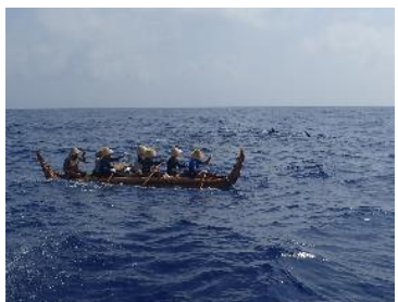
9. イルカ（オキゴンドウ）と併走