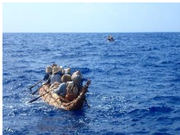
6. 沖に出て波が落ち着く