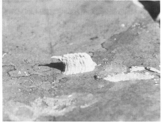
図2 アカガシの落葉上に産付されたヒナカマキリの卵鞘

本種は、台湾では長翅の雄が生息するが、国内では雌のみが知られ単為生殖をされるとされる(日浦, 前出)。しかし、山崎(前出)によれば、雌雄は形態的によく似ており、国内でも雌雄とも生息し両性生殖をするという。卵鞘は3mm程度の大きさで、おもに樹幹のはがれかけた樹皮下に産付されるが、筆者は以前アカガシの落葉上に産付された卵鞘を観察したことがある(図2)。