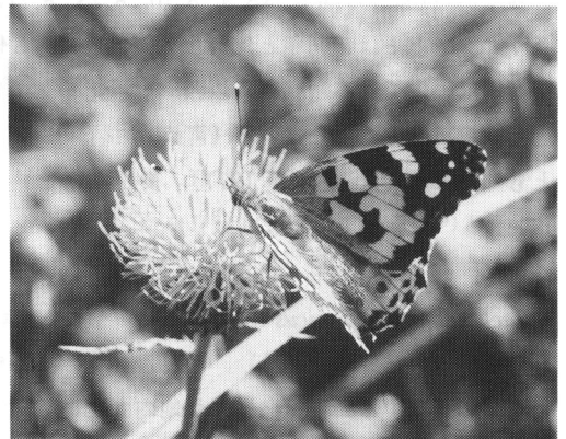
図3 ノハラアザミで吸蜜するヒメアカタテハ

これまでの記録から、本種が園内で繁殖しているのは確かであると考えられるが、発生個体は少ないらしく近年目撃例が減少している。