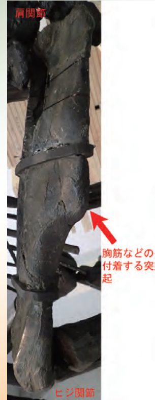
▲鳥脚類恐竜マイアサウラの右上腕骨。胸筋などの付着する突起が大きく発達していますが、このような筋肉の付着部位を特定するためには、今生きている動物の解剖学的知見が必要です。

恐竜の骨格からそれらの形態やある程度の大きさを推定することができます。このような推定は、恐竜が生きていた時にどのような動きをしていて、またどのような感覚が重要であったかについての示唆を与えてくれます。もともとヨーロッパ諸国において、恐竜類を含む化石脊椎動物の研究は、比較解剖学の中核分野として発展してきた歴史があります。解剖は現在でも古脊椎動物学の基礎を成す必須の要素なのです。