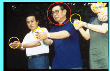
放鳥した4羽の雛（2000年7月15日） 残り3羽は7月30日放鳥