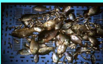
駆除したブルーギルとブラックバスの稚魚