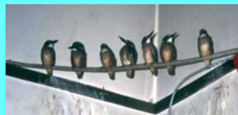
保護飼育中の7羽のカワセミの雛