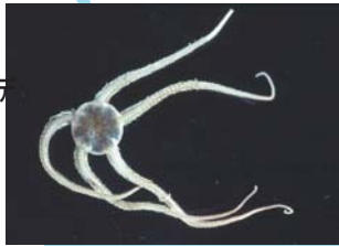
キタクシノハクモヒトデ Ophiura sarsii Lütken

ヒトデ類と同じ棘皮動物門に属する一つの分類群で、体は、中央の盤と呼ばれる円形の部分から5本の細長い腕が伸びています。ヒトデ類の一種だと思われることがありますが、ヒトデ類とは骨格の構造が異なる別の動物群です。