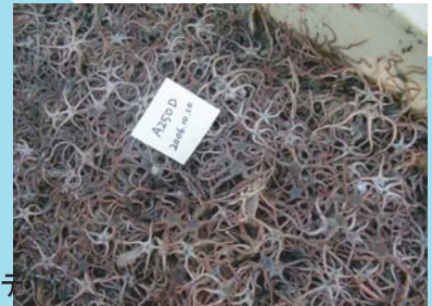
青森県八戸沖で採集された大量のキタクシノハクモヒトデ

研究船に乗って、ビームトロールと呼ばれる底曳の網をひいてみると、生き物が少ないはずの深海底から、場所によってはバケツで何杯ものクモヒトデが採集されます。「なんで深海底にこんなにたくさんのクモヒトデがいるんだろう？」と疑問に思い研究を始