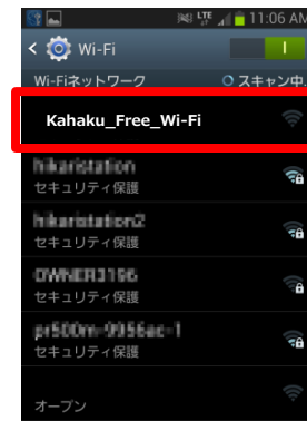
ネットワーク一覧から「Kahaku_Free_Wi-Fi」を選択