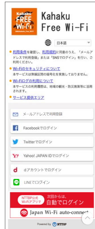
自動でポータルサイトが表示されます