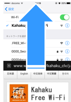
画面下部からポータル画面が自動表示されます