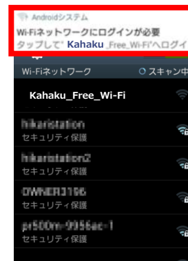
上部に通知が表示されるのでタップ