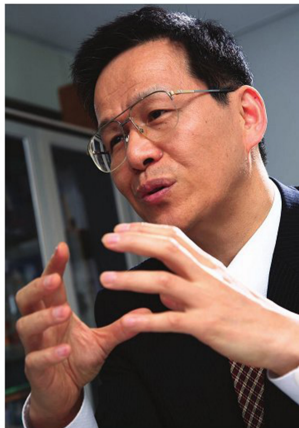
大阪大学免疫学フロンティア研究センター拠点長

つまりTLRは、病原体が共通して持っている構造を認識する受容体で、自然免疫にかかわる免疫細胞に病原体センサーとして存在しており、自然免疫と獲得免疫の間の橋渡しをします。TLRが刺激された体の部分では、サイトカイン※1やケモカイン※2という物質が出て炎症を起こすことで白血球や免疫細胞を呼び寄せて病原体を攻撃したり、あるいは抗菌ペプチド※3やインターフェロン※4を出して病原体を殺したりします。同時に、樹状細胞は、食べた病原体を表面に出した状態でリンパ節に行き、T細胞にどういった病原体が来たかを知らせます(図1)。次に同じ病原体が来たときには、獲得免疫が速やかに反応するように、獲得免疫のT細胞やB細胞表面の無数の受容体はその病原体の情報を「免疫記憶」として残しておく。これが