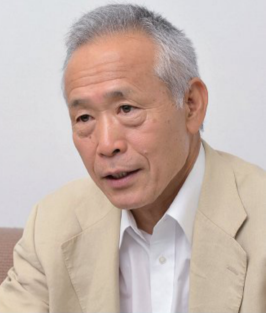
東京大学大気海洋研究所海洋生命システム研究系教授

アユは年魚 ねんぎょ といって、1年で成魚まで成長し、基本的に海と川で半年ずつ過ごします。ところが、なかには琵琶湖（滋賀県）を海に見立てて暮らしているアユもいます。琵琶湖には、琵琶湖に流入する川を上る大型のアユと、ずっと琵琶湖にいて小さなまま成熟する小型のアユがいました。両者はもともと同じグループで遺伝子的にもほぼ同じなので、両者の違いを比べたら回遊のしくみがわかるのではないかと考えたのです。この研究で役に立ったのが耳石 じせき です。耳石は脊椎動物の内耳にできる炭酸カルシウムの結晶からなる