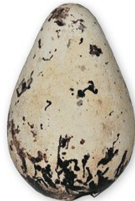
ウミガラスの卵