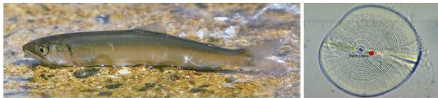
図1 アユ（左）とアユの耳石（右）

まだ大学院生だった1973年に行われた「第1次白鳳丸ウナギ産卵場調査航海 *1 」に同行したときからです。そのころはまだウナギの研究は黎明期で、あまり科学的な知識の蓄積がされてい